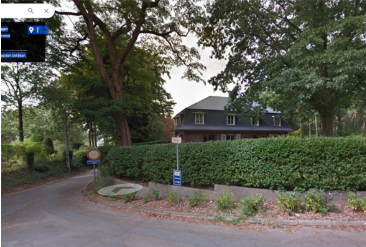
Heidestraat als rustige weg, enkel voor lokaal verkeer.

Er werden volgende maatregelen genomen om het tracé langs de Heidestraat optimaal veilig te laten verlopen: verboden in te rijden - uitgezonderd plaatselijk verkeer, invoeren zone 30. Het betreft een weg met minimaal verkeer (8 woningen). Er is dus wel degelijk een veilig, autoluw alternatief voor handen, met een extra wandelafstand van 200 meter.